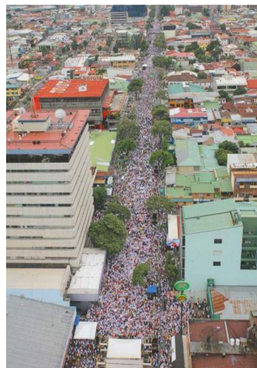
Mujeres dicen NO contra el Tratado de Libre Comercio (TLC) Octubre 2007 en Costa Rica