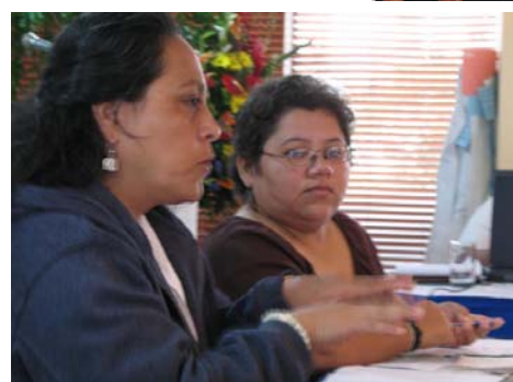
Participantes en el encuentro “Imaginando y Construyendo los Movimientos Feministas hacia el Futuro”